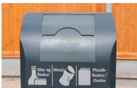
Indkast med flaskeindkast.

Renovatøren kan hurtigt tjekke det indvendige af affaldsindkastet ved at åbne den foreste låge.