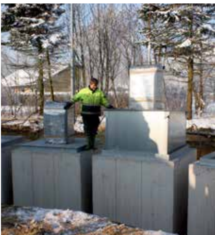
Opstilling i en cirkelbue. Inderbeholder placeres i betoncontaineren.