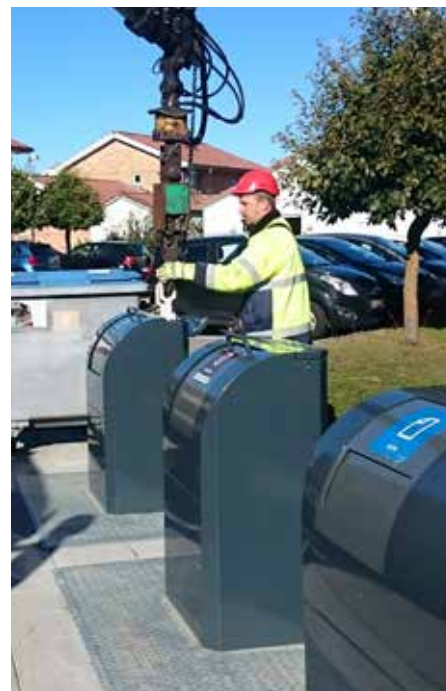
EUROPAplus kan tømmes af en mand og fås med 1, 2 eller 3 kroge.

Efter tømningsprocessen hejses containeren sikkert tilbage. Overdelen sænkes ned i betonkassen og tømningsprocessen er udført.