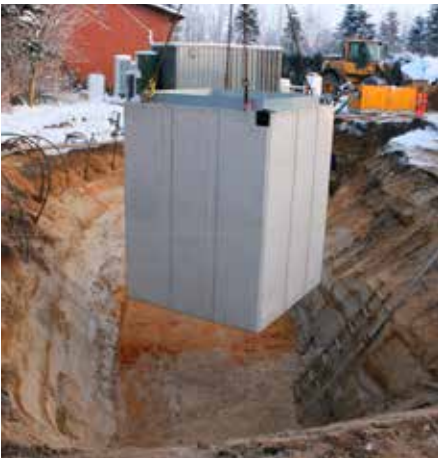
Betoncontaineren placeres i det klargjorte hul.

Se installationsvejledning for mere information om etablering.