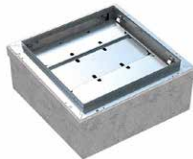
Sikkerhedsplatform der løftes automatisk.