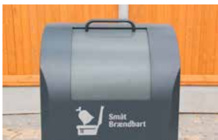
Indkast med skuffetromle.