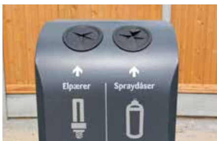
Indkast med gummiflapper.