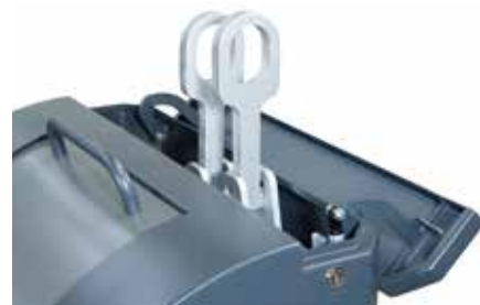
Indkast med skjulte løfteøjer.