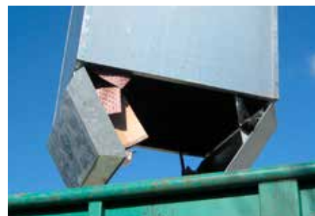
Containerens to bundstykker åbnes og affaldet ryger ud.